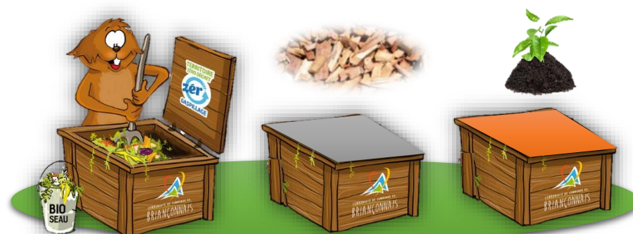
Bac de dépôt